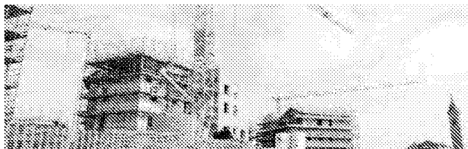
Un intervento residenziale a Quarto Inferiore

QUALCOSA che cresce c'è nella foresta di segni meno di questa lunga recessione: a Bologna e provincia siamo 66.582 in più. L'attrattiva delle Due torri non conosce crisi e in dieci anni la popolazione cresce del 7,3% raggiungendo quota 981.807 abitanti. Un aumento concentrato soprattutto nelle zone di pianura, nell'imolese e in alcuni Comuni della collina. In testa San Giorgio in Piano e Sala Bolognese che registrano incrementi del 30%, ma a ruota ci sono Granarolo e Crespellano. Solo i centri della montagna calano in controtendenza, com'è il caso di Camugnano, Castiglion dei Pepoli e Castel del Rio.